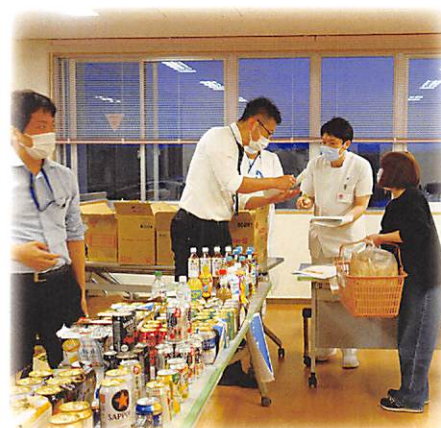
互励会テイクアウトイベント